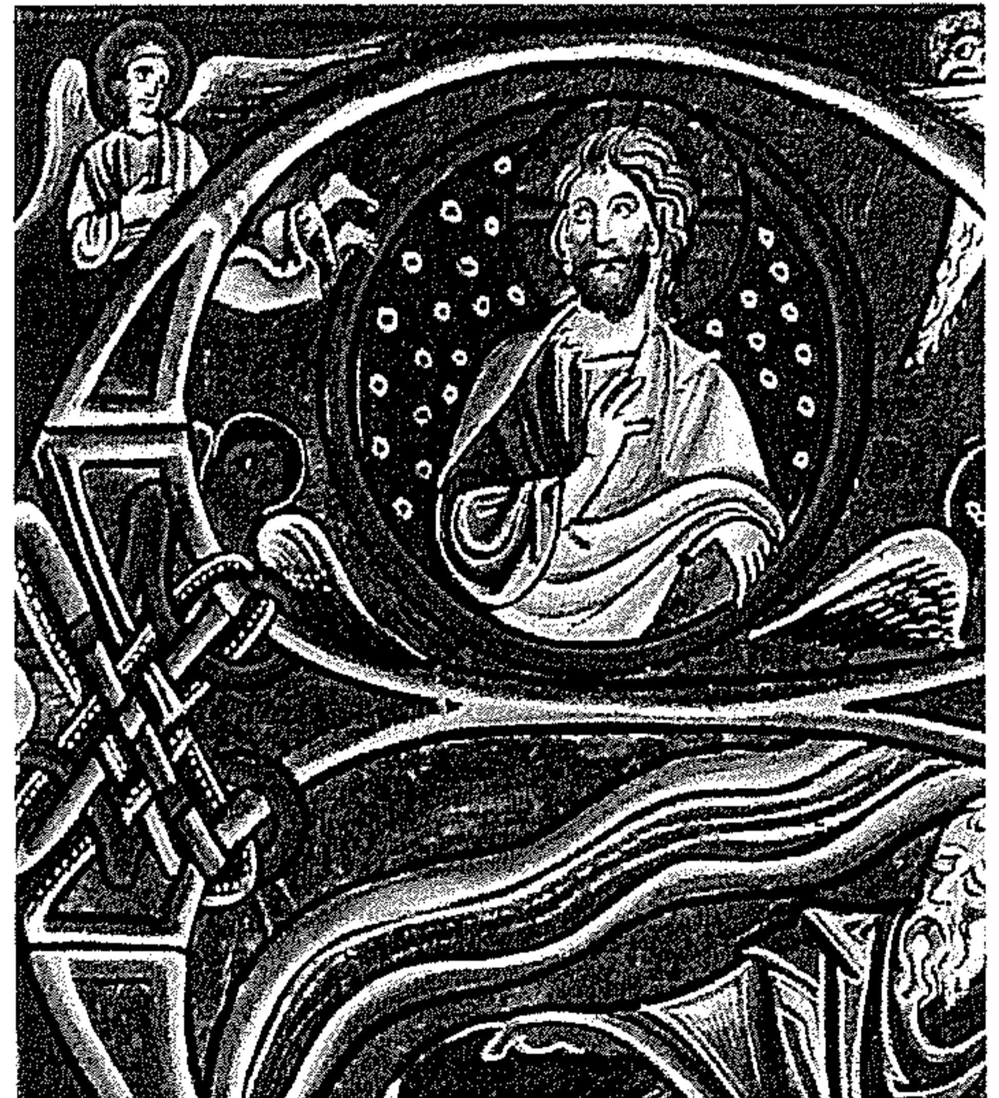
Au milieu de vous, je suis le Dieu Saint. (Os 11,9)

2 - Collaborer avec le prêtre référent de l'établissement.