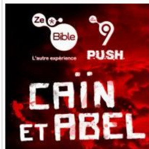
Visuel Caïn et Abel

Caïn et Abel : les frères ennemis. Avec eux, le premier meurtre fait irruption dans l'histoire de l'humanité.